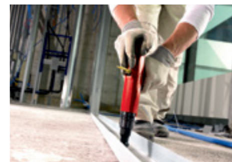
Крепление направляющих для гипсокартона