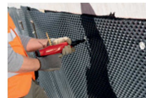
Крепление гидроизоляционных мембран