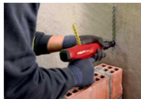
Крепление кирпичной кладки к бетону