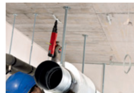
Крепление элементов для механики и электрики