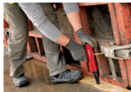
Крепление дерева к бетону (опалубочные работы)