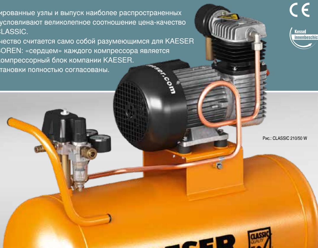
Рис.: CLASSIC 210/50 W