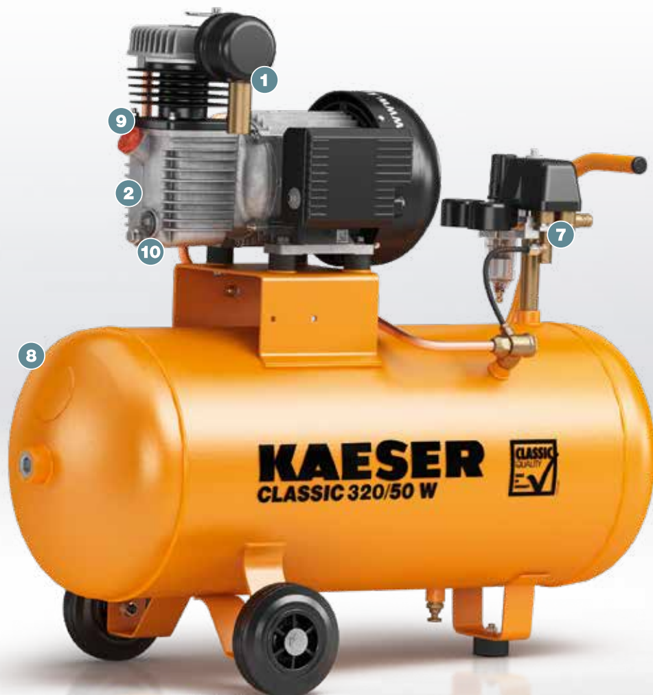
Рис.: CLASSIC 320/50 W