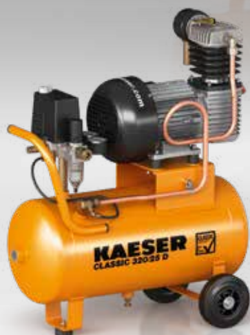
Рис.: CLASSIC 320/25 D