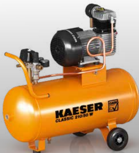
Рис.: CLASSIC 210/50 W