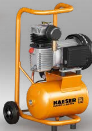
Рис.: CLASSIC mini 210/10 W