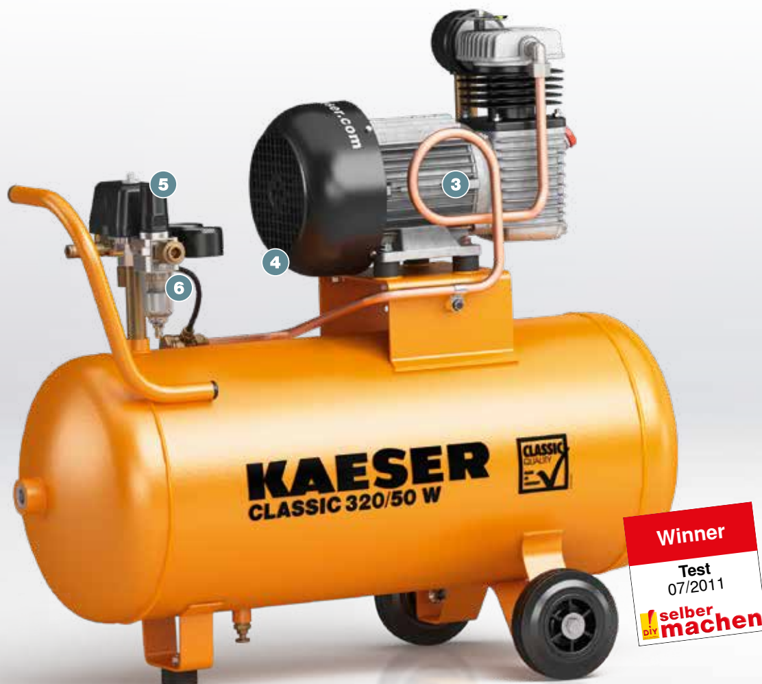
Рис.: CLASSIC 320/50 W